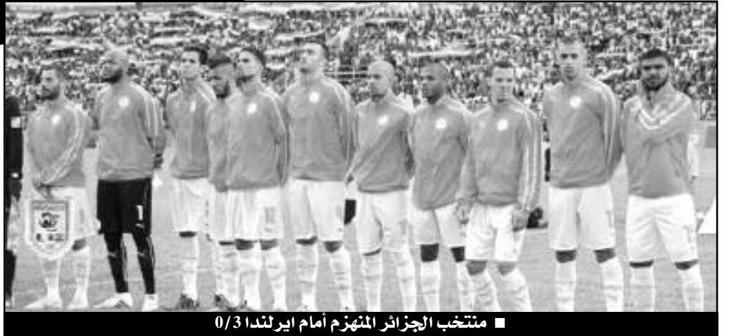
■ منتخب الجزائر المهزوم أمام إيرلندا 0/3

18 مترسدها بقوة، لكن شاوشي أبدها ببراعة. وبعدها بدقة واحدة، استغل روبي كين خطأ في محور الدفاع فانفرد بشاوشي وسدد كرة ردها القائم الأيمن. وتأتي الدقيقة الـ 84 التي اهتز لها الجمهور الجزائري الحاضر بالمدرجات، بحيث نفذ البديل عبدون ركنية ارتقى لها فديورة ولكن رأسيته الجميلة ردتها العارضة، وعادت الكرة إلى بلعيد الذي لم يحسن استغلالها. وقبل نهاية اللقاء بخمس دقائق، عمق روبي كين الفارق لمنتخب بلاده بتسجيله الهدف الثالث من ركلة جزاء نفذها بإحكام، لتنتهي المواجهة بفوز مستحق لأشبال المدرب تراباتوني.