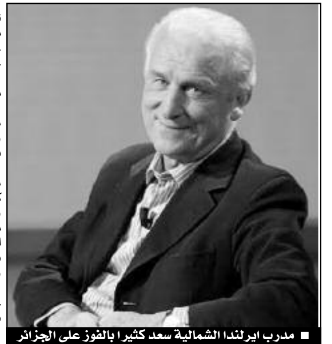
■ مدرب إيرلندا الشمالية سعد كثيرا بالفوز على الجزائر

« الأهداف التي كنا نسعى إلى تحقيقها من تريبص سويسرا تحققت بنسبة 80 ٪، وهي تعود للاعبين على مرتفعات وتكيف معها بالإضافة لاجراء فحوصات طبية كاملة وشاملة ». وقال سعدان كذلك، بان التحضيرات الفنية والتكتيكية لم تكتمل بعد بسبب الإصابات التي لاحقت بعض اللاعبين. وأكد بان العمل التكتيكي سيستمر وهناك حصص أخرها في دبلن تحضيريا للمباراة الودية ضد إيرلندا وقال أيضا