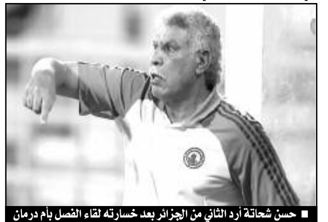
■ حسن شحاتة أرد الثاني من الجزائر بعد خسارته لقاء الفصل بأم درمان

فور تحقيق المنتخب المصري لفوز مستحق على حساب المنتخب الكامبيروني، الذي أهله إلى المربع الذهبي، بدا الحديث عن مباراة الجزائر ومصر بمدينة بانغويا، ضمن الدور نصف النهائي لكأس أمم إفريقيا التي احتضنتها دولة انغولا مطلع عام 2010، كيف لا وإن هذه المواجهة، هي الرابعة بين المنتخبين في ظرف ستة أشهر، زد على