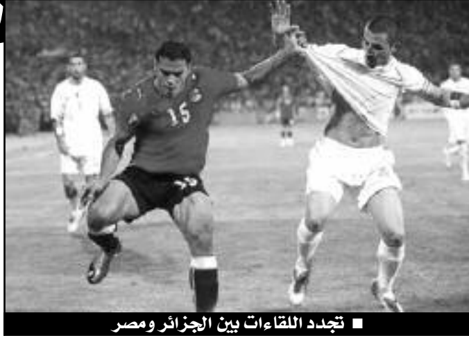
■ تجدد اللقاءات بين الجزائر ومصر

ذلك عن هذه المواجهة، تأتي بعد شهرين من مواجهة مدينة أم درمان السودانية والتي كسب معركتها منتخبنا الوطني بهدف لصفر وقعه عنتر يحيى وضع «الخضر» في مونديال جنوب إفريقيا 2010، وبالنظر للأحداث التي واكبت المباريات الثلاثة الأخيرة بين المنتخبين، جعل من لقاء مدينة بانغويا حديث مختلف وسائل الاعلام العالمية وما بالك بصحف الجزائر ومصر. إضافة إلى كل ما تم ذكره، اكتست المباراة أهمية غير عادية لكونها ستحدد أحد طرقي المباراة النهائية بل لأنها تأتي بعد شهرين من مواجهتي المنتخبين في القاهرة والخرطوم لتحديد صاحب بطاقة التأهل عن المجموعة الأفريقية الثالثة في التصنيفات المشتركة لكأس العالم ونهائيات كأس الأمم. وكانت المبارتان اللتين جرتا في القاهرة 14 نوفمبر 2009 والخرطوم في 18 نوفمبر 2009، سببتا توترا في علاقات البلدين وحملات إعلامية متبادلة واتهامات