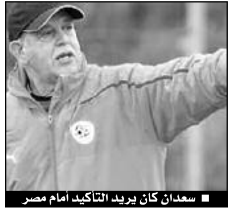
■ سعدان كان يريد التأكيد أمام مصر

إختلف مشوار المنتخبين في البطولة الحالية حيث ضربت مصر بقوة وحققت 4 انتصارات متتالية بينها فوزان مديوان على نيجيريا والكامبيرون بنتيجة واحدة 1-3 علما بأنها تخلفت 0-1 في المبارتين، رافعة رقمها القياسي في السجل الخالي من الخسارة إلى 17 مباراة