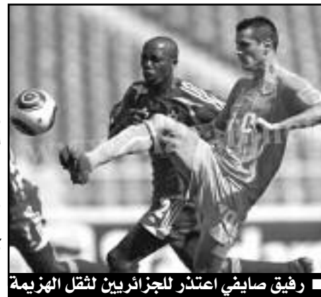
■ رفيق صايبي اعتذر للجزائريين لثقل الهزيمة

برر مدرب المنتخب الجزائري رايح سعدان بان سبب الهزيمة الساحقة التي تلقاها أمام منتخب ملاوي - وهو اضعف فريق في بطولة امم افريقيا - هو الحرارة والرطوبة العالية حسب تعبيره. كما حمل مدرب رايح سعدان الاتحاد الإفريقي لكرة القدم مسؤولية الخسارة الساحقة، بقوله في المؤتمر الصحافي الذي عقده مباشرة بعد نهاية المواجهة «اللاعبون وجدوا صعوبات كبيرة في التأقلم مع درجة الحرارة التي سادت أثناء المباراة، إضافة إلى نسبة