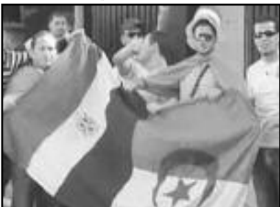
■ أفراح الجزائريين بالتأهل إلى مونديال جنوب إفريقيا 2010 تواصلت ليالي وأيام

تجمع عشرات من الشباب المصري فجر اليوم الموالي من مواجهة أم درمان أمام مقر السفارة الجزائرية بالقاهرة منددين بالإعتداء على الجمهور المصري عقب مباراة منتخب مصر والجزائر في السودان. وقال عدد من المشاركين في التجمع، إن عدد المشاركين تجاوز 250 شخصا، لكن قوات أمن كثيفة تطوق المنطقة التي تقع فيها السفارة في حي الزمالك، قامت بتفريقهم وإبعادهم بعدما رددوا