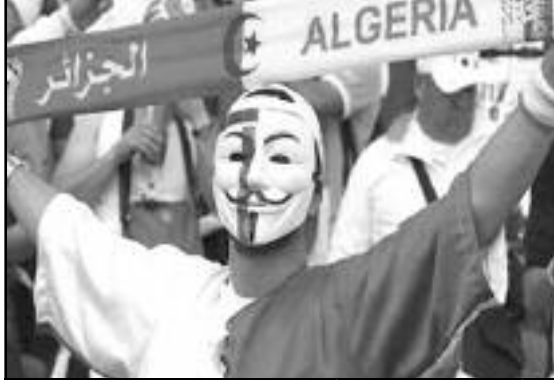
■ أفراح الجزائريين بالتأهل إلى مونديال جنوب إفريقيا 2010