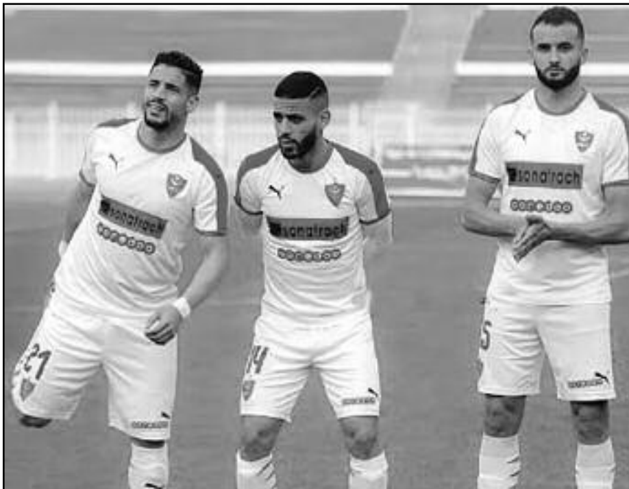
تصريحات نارية قد تخرج اللاعبين عن المباراة الهامة والمهمة.