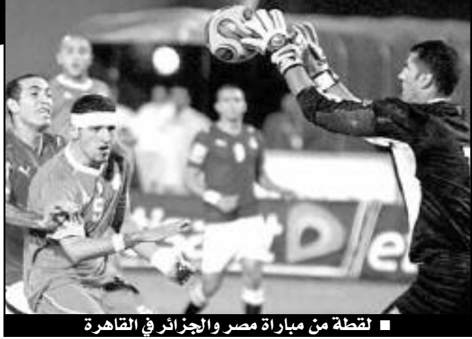
■ لحظة من مباراة مصر والجزائر في القاهرة

في القائم الأيمن للحارس فاواوي. هذا الهدف أنعش أكثر المنتخب المصري الذي حاول مواصلة الضغط في منطقة الخضر وعادوت الكرة المصرية الارتطام في القائم الأيمن للحارس. ومع مرور الوقت وجد أشبال المدرب سعدان ضالتهم ونظموا صفوفهم حيث استطاعوا نقل الخطر إلى منطقة الحارس عصام الحضري، ففي الدقيقة الـ 19 اختبر الخضر الحارس الحضري إثر مخالفة نفذها زياني وجدت رأسية حليش لكن الدفاع المصري أبعد الكرة من خط المرمى، وتمكنت العناصر الوطنية من غلق جميع المنافذ أمام مهاجمي المنافس المصري واعتمد على خطة الهجمات المعاكسة، ورغم الدعم الذي كان يجده من طرف زياني وبلحاج ومراد مغني إلا أن صاييفي وجد نفسه في عدة مناسبات معزولا في الهجوم، ويهدف لصفحة لمصلحة منتخب الفراعنة انتهى الشوط الأول. الشوط الثاني لم تكن مغايرا عن سابقه، حيث بحث المنتخب الجزائري عن هدف التعادل لتعقيد مهمة المصريين وضيق صاييفي في عمل فردي في الدقيقة الـ 56 هدف التعادل بعدما وجد نفسه وجها لوجه مع الحارس عصام الحضري الذي