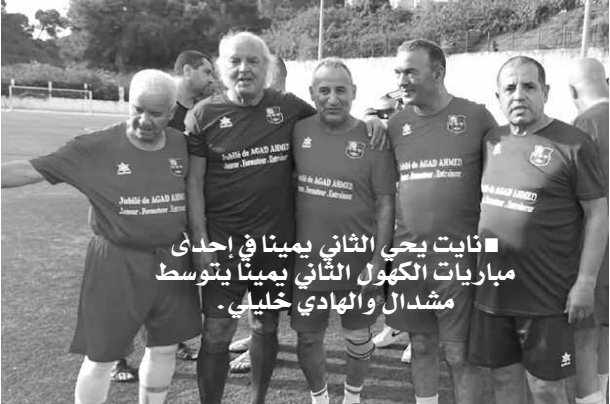
■ نايت يحي الثاني يميّنا بتوسط مباريات الكهول الثاني يميّنا بتوسط مشدال والهادي خليلي.