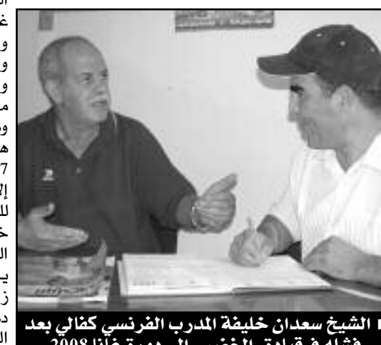
■ الشيخ سعدان خليفة المدرب الفرنسي كفالي بعد فشله في قيادة «الخضر» إلى دورة غانا 2008

خاض المنتخب الوطني الجزائر تصفيات كأس إفريقيا (غانا 2008)، أمام المنتخب الغامبي بملعب هذا الأخير، كانت هذه المواجهة أشبه بالودية لكلا المنتخبين، بعد إقصائهما في الجولة ماقبل الأخيرة،