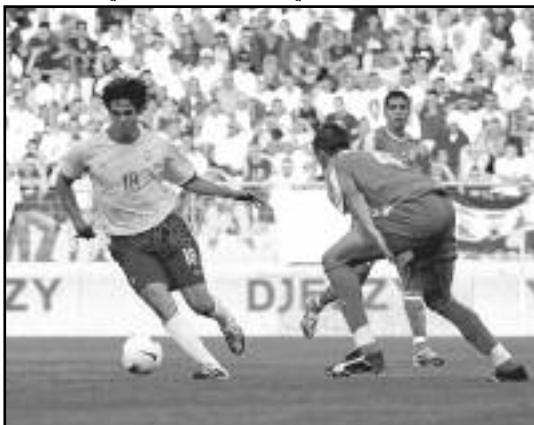
■ لقطة من مباراة الجزائر والبرازيل بمدينة مونيبيلي الفرنسية

خاض المنتخب الوطني هذه المواجهة بالأسماء التالية: لوناواس قاواوي، حسني، عمر شاذلي، مجيد بوقرة، بوزيد، عنتر يحيى (عامر بوعزة)، زرابي عبد