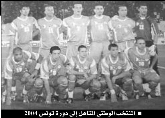
■ المنتخب الوطني المتاهل إلى دورة تونس 2004