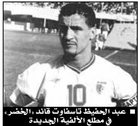
■ عبد الحفيظ تاسفاوت قائد «الخضر» في مطلع الألفية الجديدة

تاريخية بخمسة أهداف لهدفين. خاض المنتخب الوطني هذه المواجهة بالتشكيلة التالية: بوغرارة (بلهاني)، رحو (ميصايح)، دريوش، منيري، ماموني، بلباس، ذيري، بن عربي، تاسفاوت، كراوش، بلماضي (بورحلي). المدرب: عبد الغني جداوي