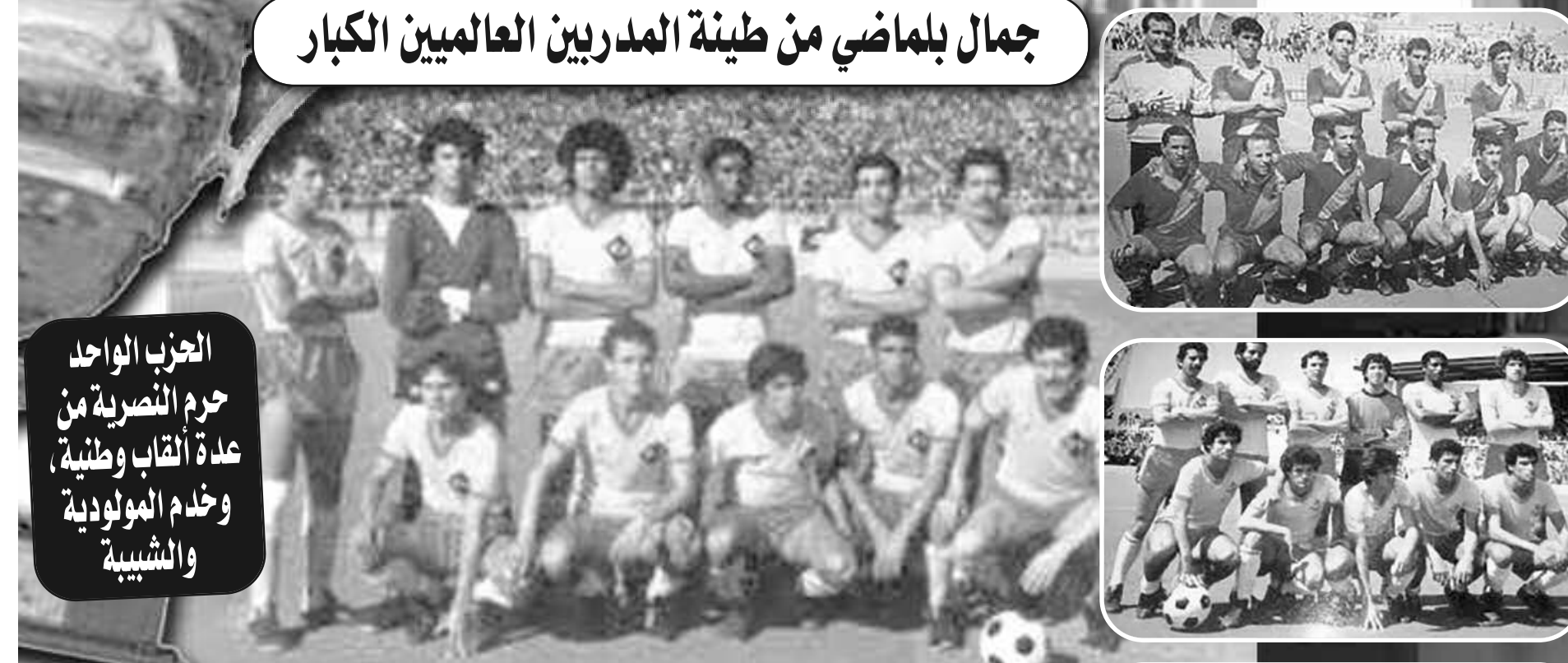
جمال بلماضي من طينة المدربين العالميين الكبار

الحزب الواحد حرم النصرية من عدة الألقاب وطنية، وخدم المولودية والشبيبة