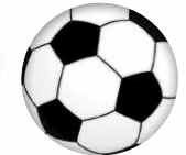
حاوره: كريم مهدي

اتحادية زطشي تسعى جاهدة لحرمان اللاعبين الدوليين من شهادات تدريب «كاف س»