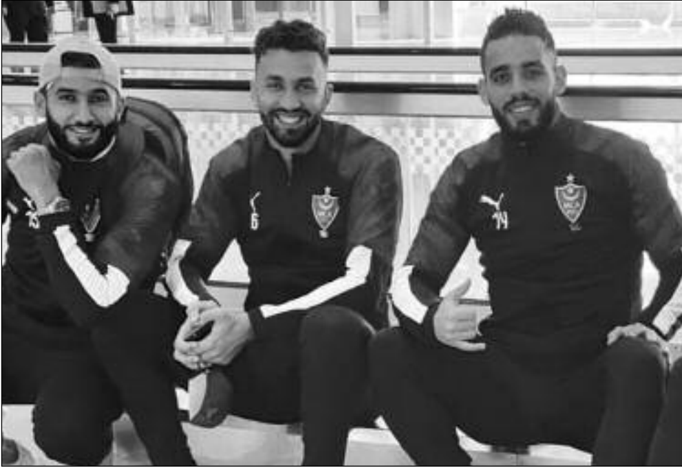
ماراتون من المباريات في البطولة. أن تؤثر على مجريات المواجهة.