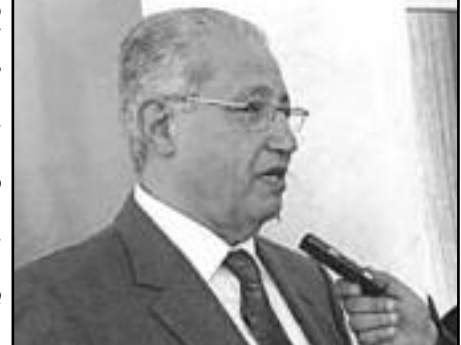
المدرّب كمال لموي خليفة روغوف بعد كأس افريقيا بالمغرب 1988