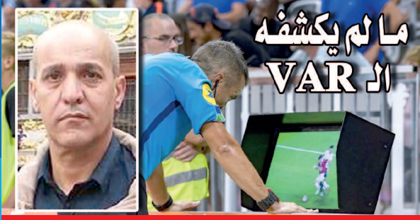
بقلم: فريد نزار