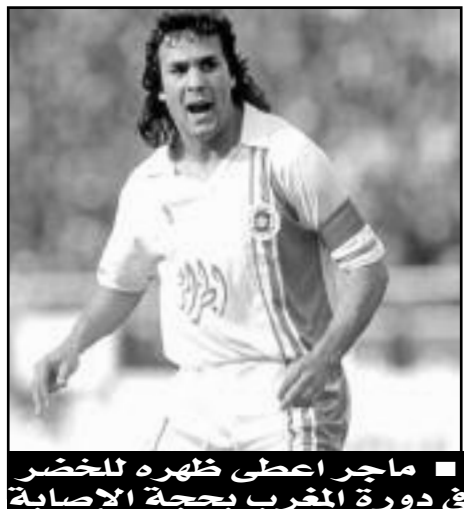
ماجرا أعطى ظهره للخضر في دورة المغرب بحجة الإصابة

بعد تعادله هدف لمتله في اللقاء الأول أمام المنتخب الإفريقي في دورة المغرب 1988، وخسارته المواجهة الثانية أمام المنتخب المغربي بهدف دون رد، كان لزاما على أشبال الراحل المدرب روغوف تحقيق الفوز على منتخب جمهورية الكونغو، على الأقل بهدف دون رد، وانتظار نتيجة مباراة المغرب وكوت ديفوار، وهو ما حققه اللاعب قادر فرحاي في الدقيقة 34، وبالرغم