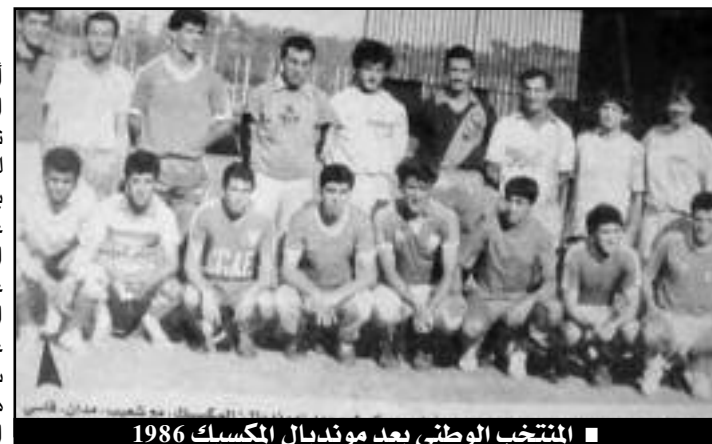
■ المنتخب الوطني بعد مونديال المكسيك 1986

لهدفين كاملين، الأول وقعه اللاعب سانجاق في الدقيقة الـ 97 والثاني وقعه جمال مناد في الدقيقة الـ 117، لم يترك فيه أي فرصة للاعبين السودانيين في الرد على هدف جمال، مناد، وفي ظل تأسف السودانيين على تلقيهم الهدف الثالث، وإذا بالحكم لعويسي يعلن صافرة النهاية بتأهل منتخبنا الوطني إلى الدور الثاني. خاض المنتخب الوطني هذه المواجهة بالأسماء التالية: دريد، محمد شعيب، بن حليمة (رشيد مطر)، بلغري عبد الرزاق، مغارية، قاسي سعيد محمد، سانجاق كشامل، مناد بلومي، ماجر. المدرب: روغوف