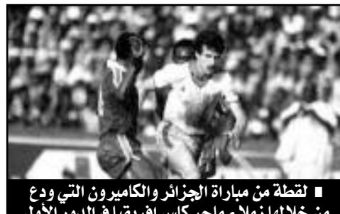
لقطة من مباراة الجزائر والكامبيون التي ودع من خلالها زملاء ماجر كأس أفريقيا في الدور الأول