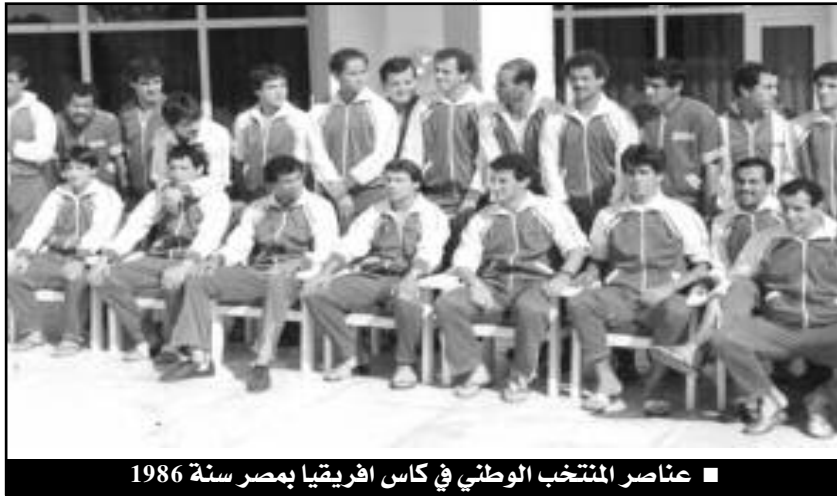
عناصر المنتخب الوطني في كأس أفريقيا بمصر سنة 1986

المواجهة الثانية ضمن نهائيات كأس أمم إفريقيا بمصر كانت أمام المنتخب الزامبي، وخلالها وقف زملاء كالتوتشا