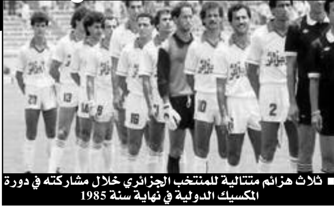
ثلاث هزائم متتالية للمنتخب الجزائري خلال مشاركته في دورة المكسيك الدولية في نهاية سنة 1985