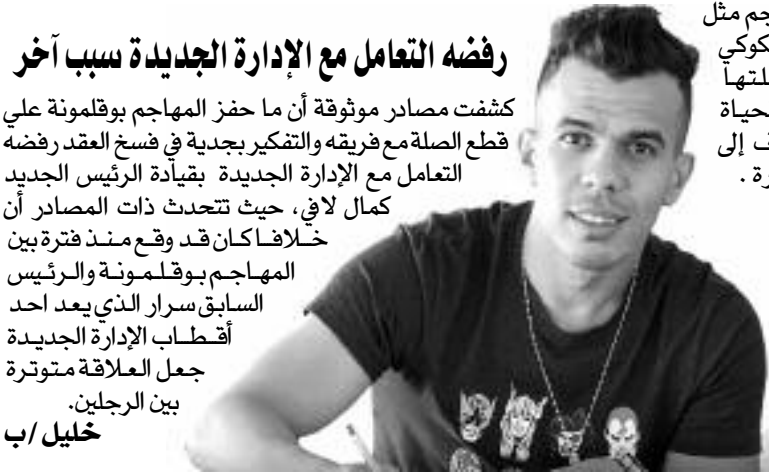
يريد الحضور من اجل فسخ العقد والمغادرة