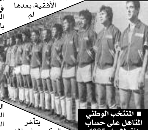
المنتخب الوطني المتأهل على حساب انغولا عام 1985

خاض الفريق الوطني مباراة العودة أمام زامبيا بلوزاكا بالأسماء التالية: دريد، صادمي، فوزي منصورى، مغاريا، قندوز، قاسي سعيد محمد، مناد، ماروك، بن ساولة، ماجر (جفجاف)، صالح عصاد (حسين يحيى). المدرب: رابح سعدان