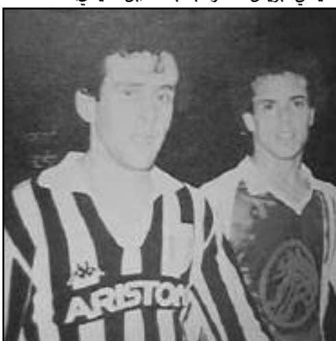
لخضر بلومي رفقة الفرنسي ميشال بلاتيني خلال مباراة الجزائر وجوفنتوس بملعب 5 جويلية في ربيع 1985

يتأخر الحكم بإعلان صافرة النهاية، النهاية التي تنفس الجزائريون الصعداء. وعلى وقع نتيجة 2/3، انتهت هذه المواجهة التي خاضها الفريق الوطني هذه المواجهة بالأسماء التالية: دريد، مرزقان، فوزي منصورى (بن شيخ)، مغارية، قندوز، مغيشي، بويش ناصر، جفجاف (بن خليدي)، مناد،