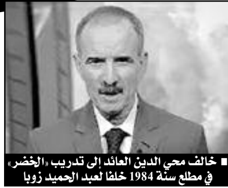
■ خالف محي الدين العائد إلى تدريب «الخضر» في مطلع سنة 1984 خلفا لعبد الحميد زويا

خاض الفريق الوطني آخر مباراة له في سنة 1983،