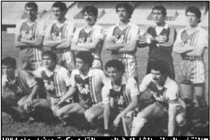
■ المنتخب الوطني المشارك في العرس القاري بكونت ديفوار عام 1984

التقى المنتخبين الجزائري والمصري لتحديد هوية المتأهل إلى دورة لوس أنجلس الأولمبية يوم 17 فيفري بالعاصمة المصرية القاهرة، أمام حوالي 100 ألف متفرج، وتولى إدارتها الحكم السنغالي الشهر مياي، وخلالها، عمل المصريون كل ما في وسعهم من أجل انتزاع تأشيرة التأهل من منتخبنا الوطني، فكان له ذلك في الدقيقة النبيل في الدقيقة 56، وهي النتيجة النهائية لهذه المواجهة التي كانت نهايتها