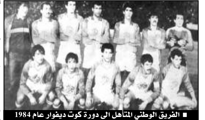
■ الفريق الوطني المتأهل إلى دورة كوت ديفوار عام 1984

بعد أسبوعين عن مواجهة العودة التقى المنتخبين من جديد في لقاء العودة بملعب 5 جويلية من أجل تحديد هوية المتأهل إلى الدور التصفيوي الثالث والأخير لأولمبياد لوس أنجلس 1984، وأدارها الحكم الفيني