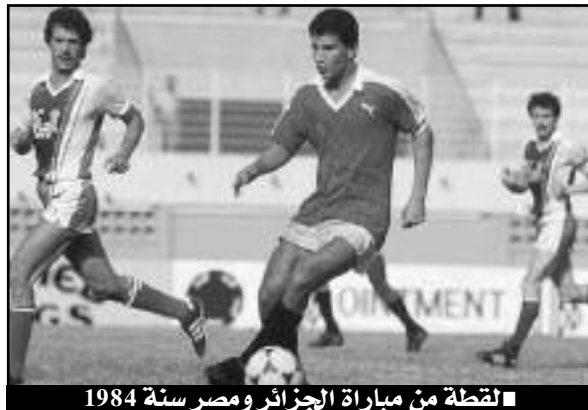
■ لقطة من مباراة الجزائر ومصر سنة 1984

بعد ثماني سنوات عن آخر مواجهة جمعت المنتخبين