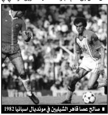
صالح عصاد قاهر الشيليين في مونديال اسبانيا 1982

الآن نصل إلى أهم مباراة خاضها الفريق الوطني في