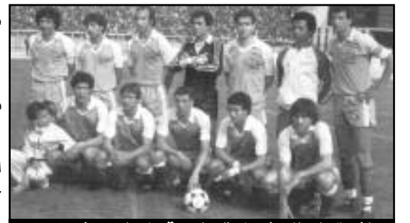
الفريق الوطني في مباراته الودية أمام البيرو في ربيع 1982