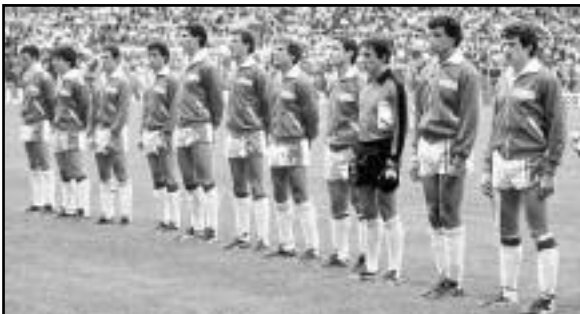
المنتخب الوطني المتفوق على المنتخب الألماني 1982

المباراة الودية الموالية، كانت أمام منتخب ايرلندا الجنوبية، احتضنها ملعب 5 جويلية وأدارها الحكم الفرنسي المباريات، وفيها قدم الفريق الوطني ادعاء جيدا، نال رضا الجماهير الغفيرة التي أمت مدرجات ملعب 5 جويلية والتي فاق عددها عن الـ60 ألف متفرج. تداول على تسجيل الهدفين الثنائي صالح عصاد في