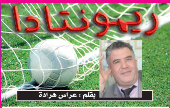
بقلم : عباس هرادة