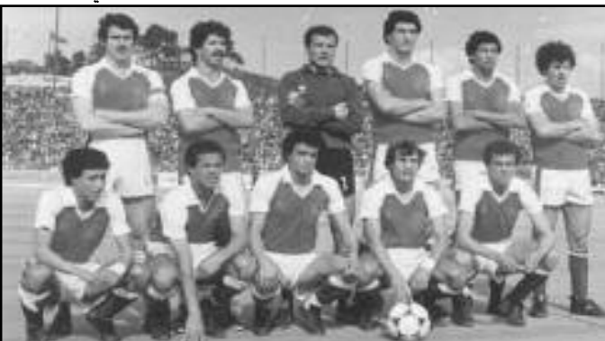
■ المنتخب الوطني أمام النيجر في تصفيات مونديال اسبانيا 1982

أوقعت قرعة الدور التصفيوي الرابع والأخير لمونديال اسبانيا 1982 منتخبنا الوطني أمام المنتخب النيجيري،