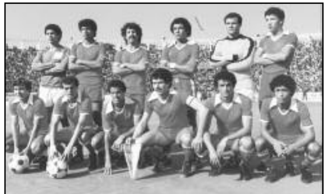
المنتخب الوطني الفائز على بوركينافاسو بوهران 0/7