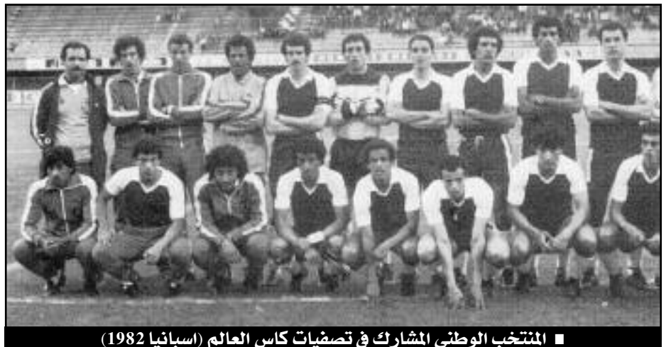
المنتخب الوطني المشارك في تصفيات كأس العالم (اسبانيا 1982)

بعد الأداء الرائع الذي قدمته العناصر الوطنية في دورة