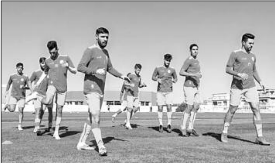
البرج بملعب 1 نوفمبر بتيزي وزو، المنافسة الرسمية.