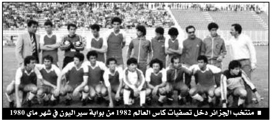
■ منتخب الجزائر دخل تصفيات كأس العالم 1982 من بوابة سيراليون في شهر ماي 1980

المدرب خالف محي الدين من فريتاون، والنتائج الرائعة المسجلة في دورة نيجيريا ببلوغه الدور النهائي. أدار اللقاء الليبي الشهير الغول، وفيها لم تجد العناصر الوطنية أدنى صعوبة في تحقيق الفوز، بنتيجة ثلاثة أهداف لهدف، في مباراة أهدر فيها زملاء فرقاني العديد من الفرص السانحة للتسجيل.