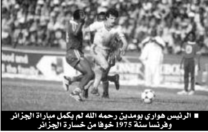
■ الرئيس هواري بومدين رحمه الله لم يكمل مباراة الجزائر وفرنسا سنة 1975 خوفا من خسارة الجزائر

عكس كل التكهانات، نشط منتخبنا الوطني المباراة